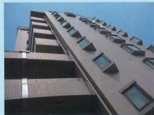
施工後の様子。外観の変化はありません。(※1)