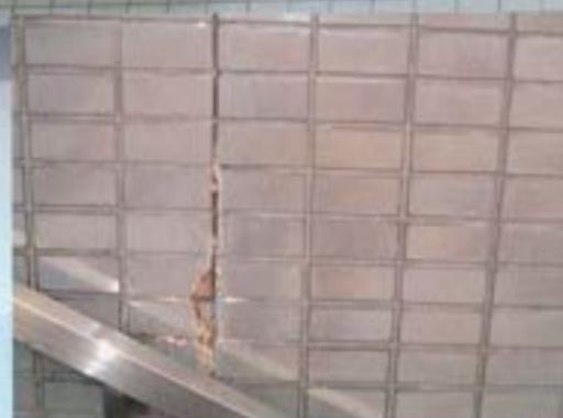
エフロは美観性を損なうだけでなく、タイルの剥落の原因となります。

(注意事項：酸性洗剤を用いて洗浄後に塗布した場合には変色するおそれがあります。 必ず専用のアルカリ洗剤にて中和処理後に塗布してください。)