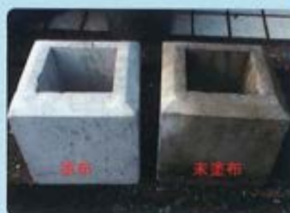
6ヶ月経過後の写真(右塗布・左未塗布)

黒カビや雨垂れで黒ずんでしまったコンクリート面やタイル面も、Sクリートガード®が強固に守り、建物の美しさと強さを保ちます。