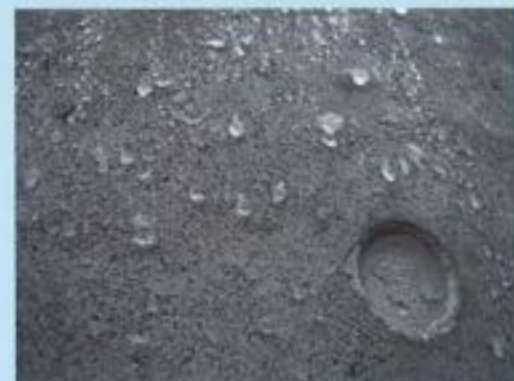
施工後数年後の排水性能