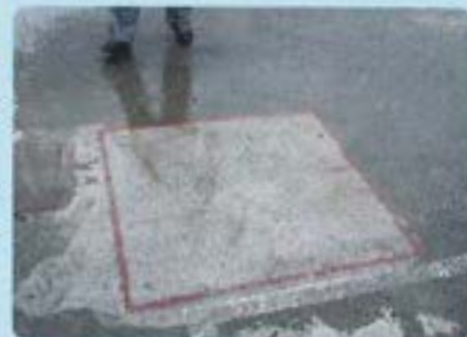
北海道 屋上駐車場コンクリート床 6年経過後の写真(赤枠内のみ試験施工)

Sクリートガード®は氷点下20℃までの温度環境でも施工可能です。凍結融解や融雪剤など、コンクリートにとって厳しい環境でも優れた効果を発揮します。