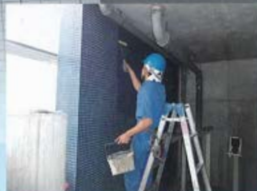
タイル面へのローラーによる施工