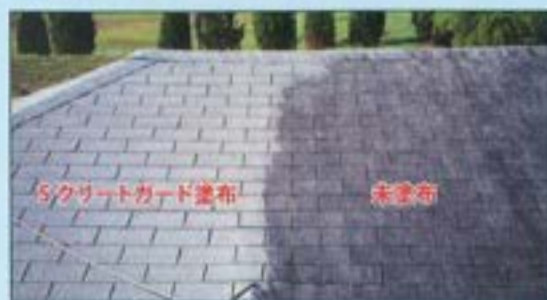
セメントタイルへの施工