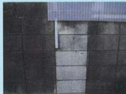
黒カビで汚れたセメントブロックの一部にSクリートガードを塗布した実験です。Sクリートガードの高いセルフクリーニング効果により、黒カビが徐々に消失していきます。(※2)